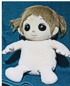
白眼付けたネルル