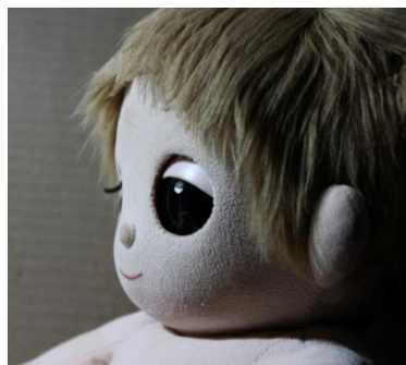
右目のまつ毛取付け